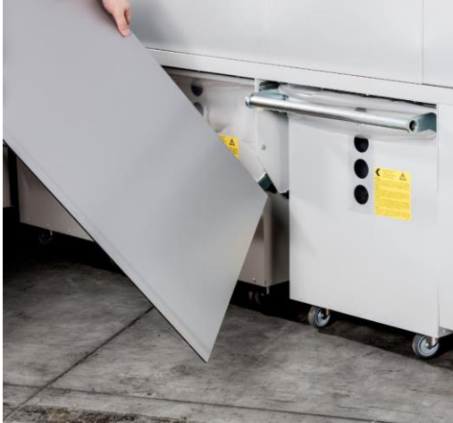
Spänecontainer mit Staubschott

Die Auslieferung erfolgt steckerfertig, nur der Spänesack muss noch eingelegt werden. Mit geringem Montageaufwand lässt sich jederzeit die Auszugsrichtung des Abfüllbehälters, links-rechts Auszug, ändern.